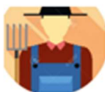
Cheval Daniel Retraité secteur Agricole